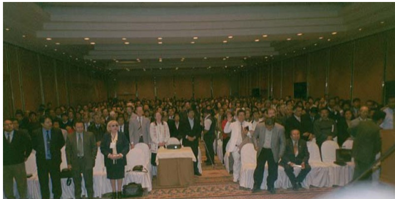
Publicul participând la adunarea din Hotelul Sheraton, Lima, Peru