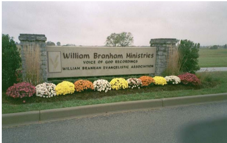
Semnul de bun venit la intrarea în "Voice of God Recordings" în Jeffersonville, Indiana, SUA.