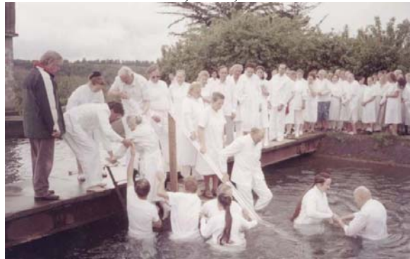
Câțiva credincioși din Chile botezați în Numele Domnului Isus Hristos